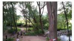
Het verlegde voetpad langs de Geul.

Het verlegde voetpad langs de Geul tussen uitspanning Tivoli in Valkenburg en Geulhem wordt verhard en is daarom van daag en morgen af gesloten. Het bestaande pad werd in juli een paar meter opgeschoven omdat de oeverwand van de Geul telkens afbrokkelde. De werkzaamheden liepen uit doordat er in de ondergrond onbekend leidingen bleken te zitten. Het nieuwe pad werd aan het begin van de bouwvak opengesteld, maar moet nog worden afgewerkt met een stevige toplaag. Dat gebeurt vandaag en morgen.