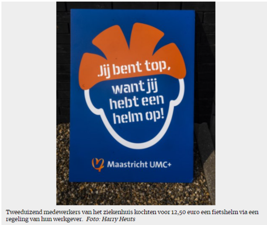
Tweeduizend medewerkers van het ziekenhuis kochten voor 12,50 euro een fietshelm via een regeling van hun werkgever.

De campagne mag zich momenteel op 60-plussers richten, we moeten ons vooral niet inbeelden dat anderen onkwetsbaar zijn, ziet deze intensivist en neuroloog. „Op mijn ic zie ik ook de huis-tuin-en-keuken ongelukken. Met een helm ontstaat er volgens buitenlandse cijfers 50 tot 70 procent minder hersenletsel. Nederlandse cijfers gaan uit van 33 procent. Bedenk dat ook een ‘gewone’ hersenschudding al tot ‘puntbloedinkjes’ leidt. Ik kan geen ingreep bedenken met zoveel rendement als het opzetten van een helm.”